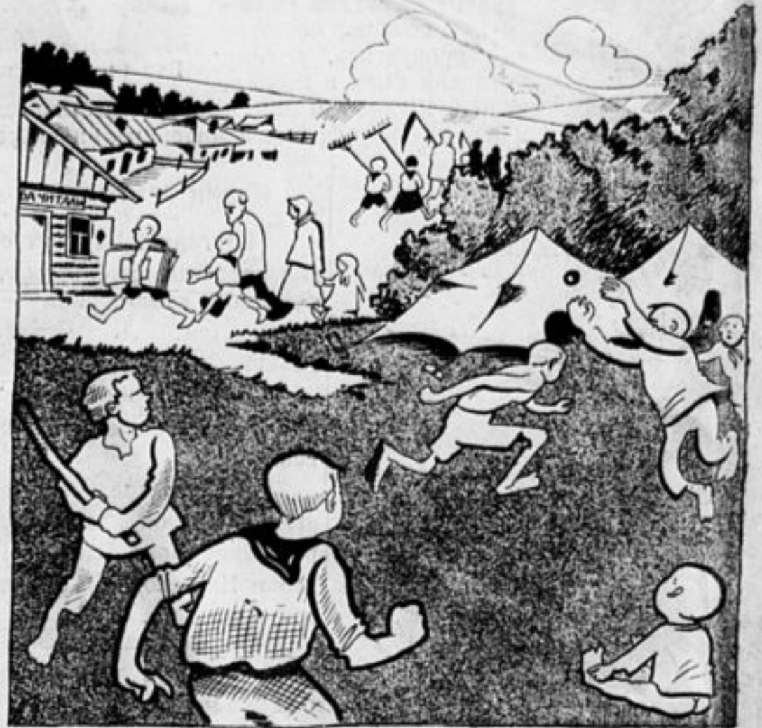
укрепят смычку города и деревни