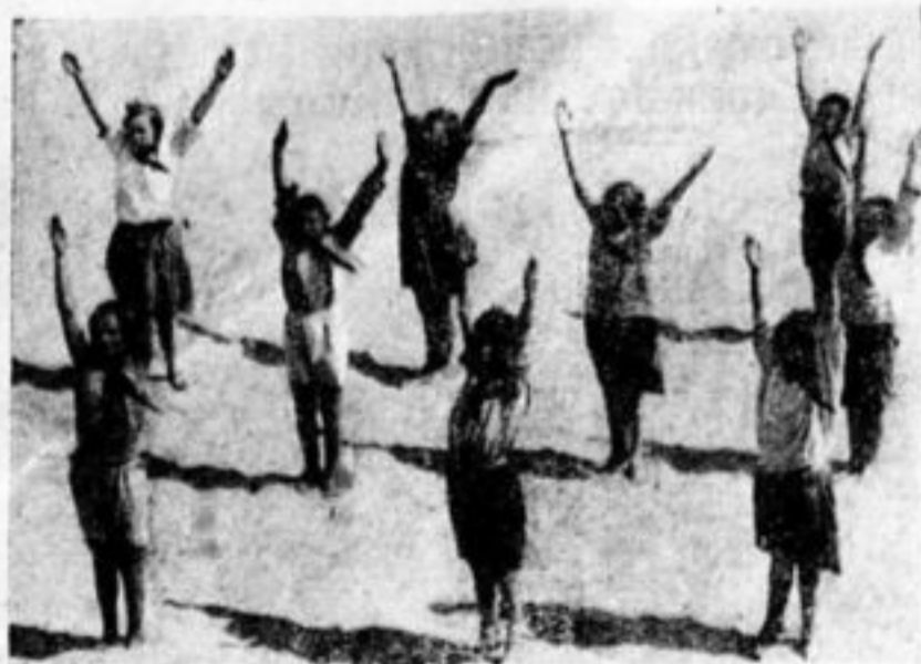
Физкультурой победим туберкулез.

Туберкулез оставило нам еще царское правительство, фабриканты и помещики, держа рабочих у себя как рабов, в плохих условиях, в непосильном труде. Сейчас проводится трехдневник борьбы с туберкулезом, как со злейшим бичем трудя-