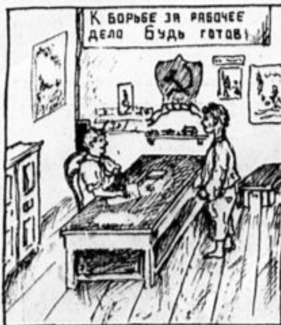
Я! — сказал Сенька.

Сенька не знал, конечно, что записавший его парень говорил истом с другими пионериами: