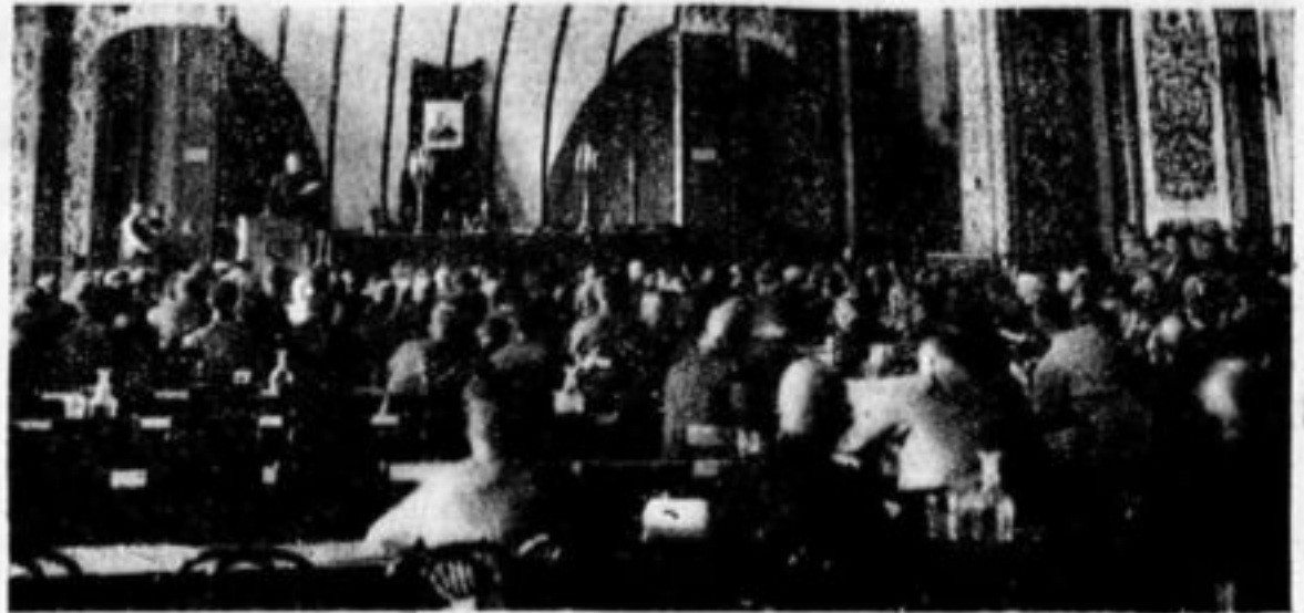
Первое заседание нового ЦИК СССР.

22 мая под председательством т. Калинин состоялось заседание ЦИК СССР, избранного III Съездом Советов СССР. Выбран президиум ЦИК СССР из 27 товарищей: Калинин, Петровский, Червяков, Наменов и др.