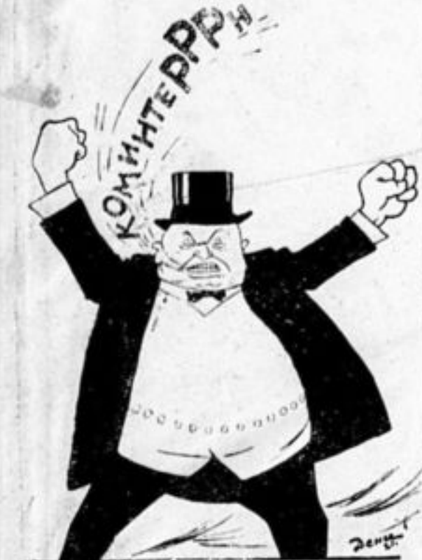
Коминтерн пугает буржуазию.