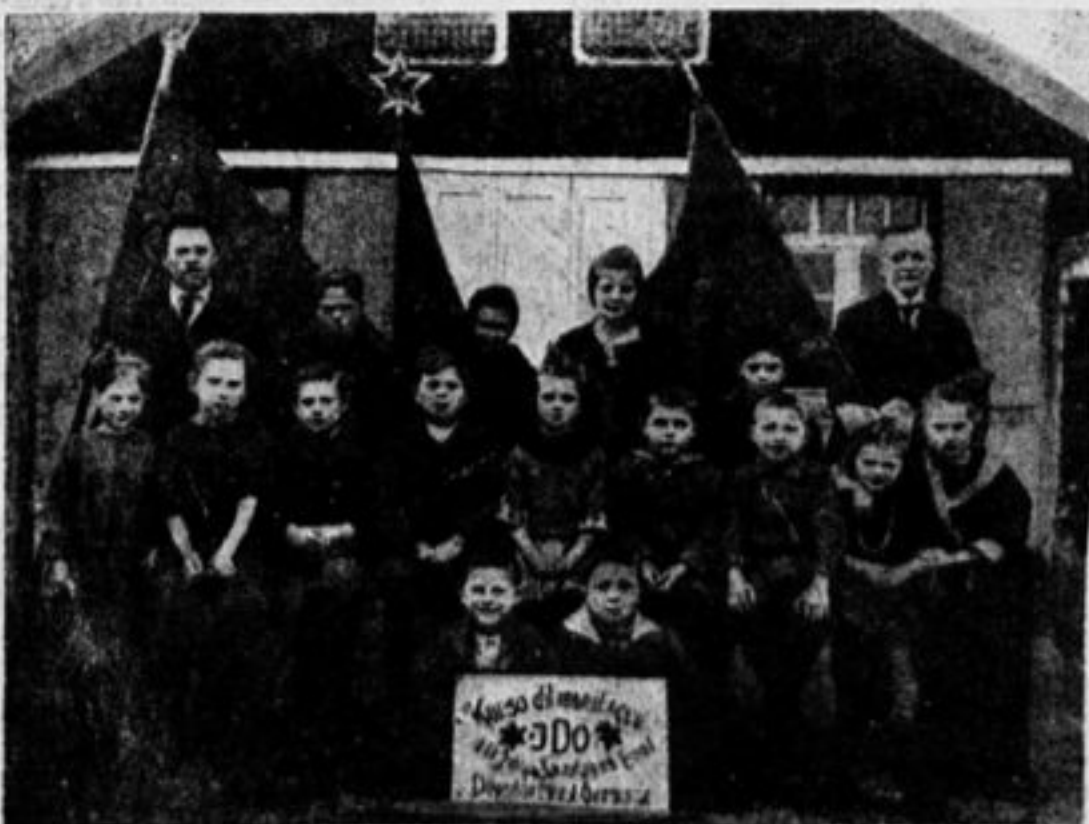
Курсы международного языка идо детком групп г. Дрездена (Германия).